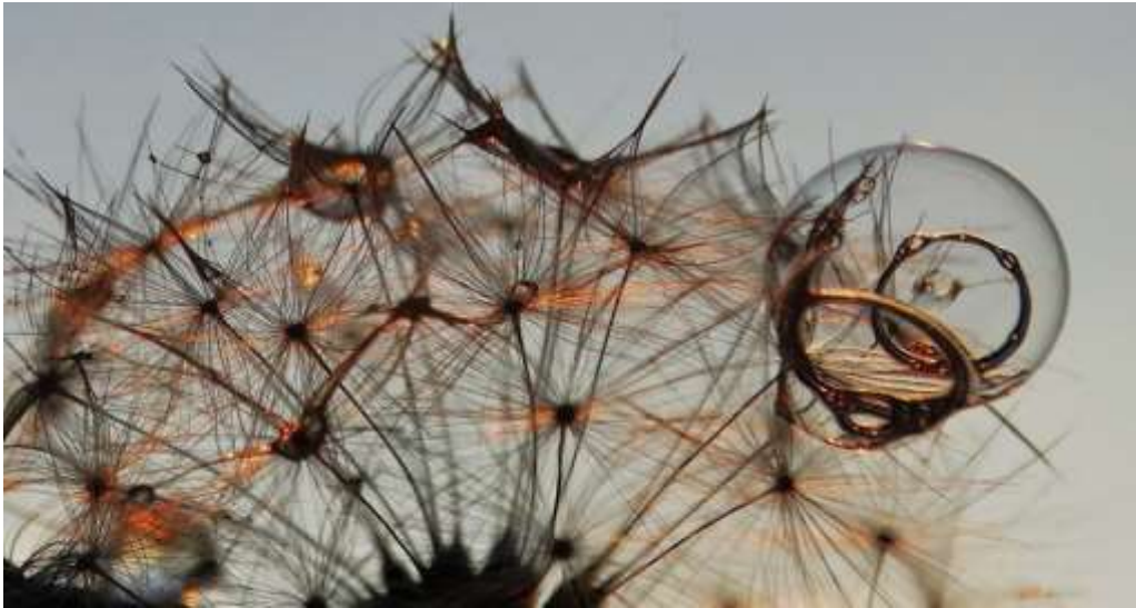
Photographie de Cynthia Ruiz

Projection sur écran de ses photographies artistiques. Plusieurs de ses photos seront exposées aussi dans la salle.